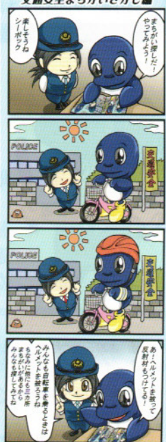
答えは、右下を確認してね!