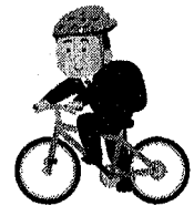
自転車等ヘルメットの着用