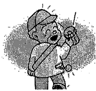
反射材等の着用促進