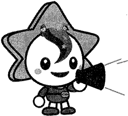
茂原市マスコットキャラクター 「モバリん」

そこで、皆様が道の駅に求める機能や施設について、アンケート調査を実施しますので、ご協力をお願いいたします。