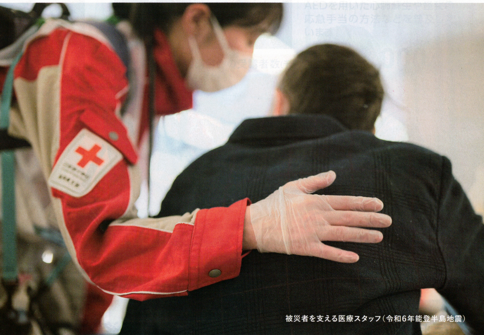
被災者を支える医療スタッフ(令和6年能登半島地震)