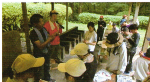
スターターキットで火起こし練習