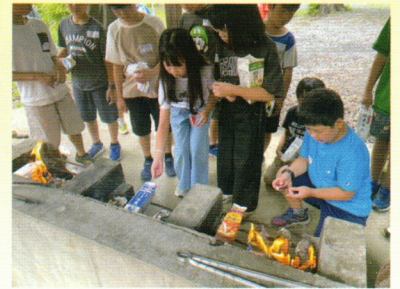
朝食は牛乳パックで作るホットドッグ