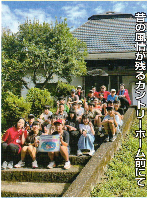
昔の風情が残るカントリーホーム前にて