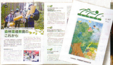
広報誌グリーンエッセンスの発行等