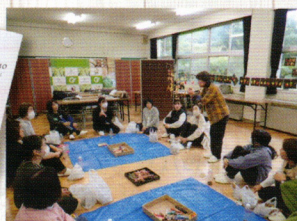
みどりの教室(袖ヶ浦市)