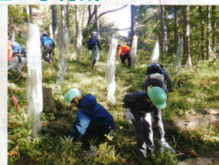
第44回緑の少年団交流集会(大多喜町)