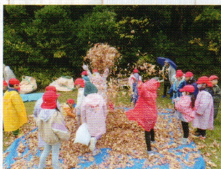
小学校の校外学習支援(袖ヶ浦市)