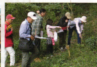
ときがね湖自然観察会(東金市)