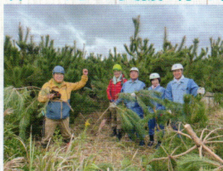
緑の募金の森(海岸林)の造成(旭市)