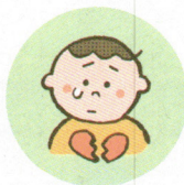
こどもの心や自尊心を傷つけるような言動をしたり、繰り返し言うこと