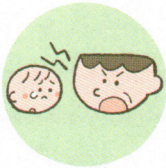
言葉で脅したり、脅迫すること

体罰は暴力でこどもの身体を傷つけるもので、心理的虐待は暴言などでこどもの心に深い傷を負わせるものです。こども本人への暴言でなくとも、配偶者や家族に対する強い言葉などもこどもの心を傷つけ、発達に影響する可能性があります。