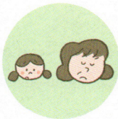
こどもを無視したり、拒否的な態度を示すこと