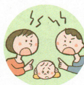
配偶者への暴力や暴言をこどもに見せること