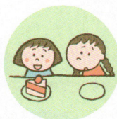
他のきょうだいとは著しく差別的な扱いをすること