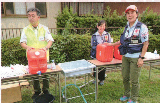
茂原市災害ボランティアセンターで運営を手伝いました