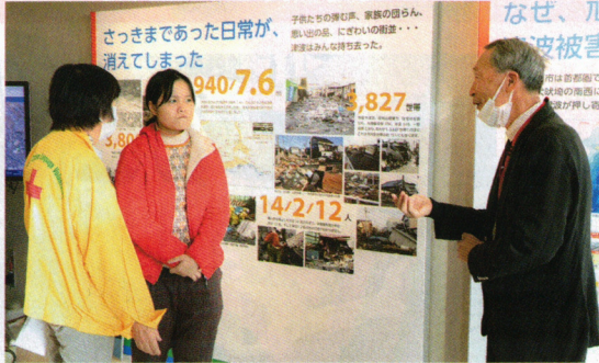
旭市防災資料館で、東日本大震災についての説明に、真剣に耳を傾けていました