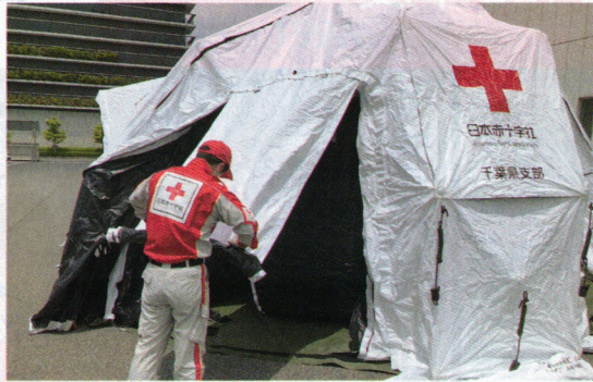
災害時に、救護所等に使用されるテントの設営訓練を行いました