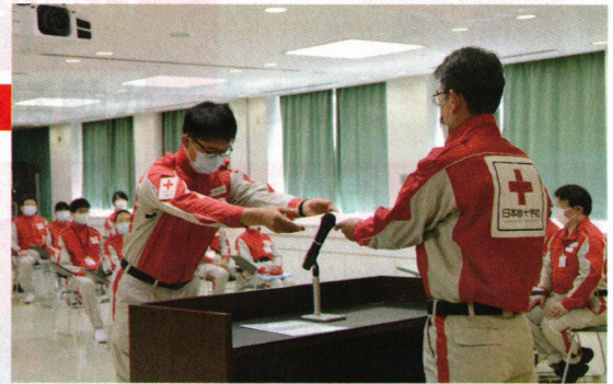
医療救護班の任命をしました

青少年赤十字指導者協議会役員会・総会 防災ボランティア推進協議会 地区・分区新任事務委員研修会