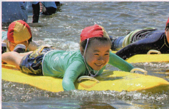
子どもたちに水の事故からいのちを守る方法を伝えました