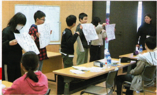
青少年赤十字のメンバーが2泊3日の研修を行いました

救急法指導員養成研修 救急法イベント 救護班要員(主事)研修会 レッドクロス・ボランティアスクール 青少年赤十字スタディーセンター