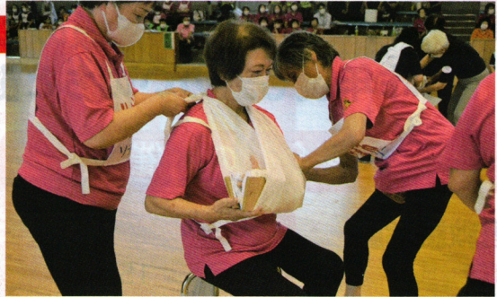
救急法フェスタで奉仕団が応急手当の技術を披露しました

救急法フェスタ2023 航空機事故消火救難総合訓練 日本赤十字社第2ブロック支部総合訓練