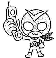
確認戦士カクニンダー

【ロマンス詐欺】～SNSのダイレクトメッセージでやりとりを繰り返し、自身に好意があると思わせ、恋愛感情が高まったところで「2人の将来のために資産を蓄えよう」などと言って金銭をだましとります。