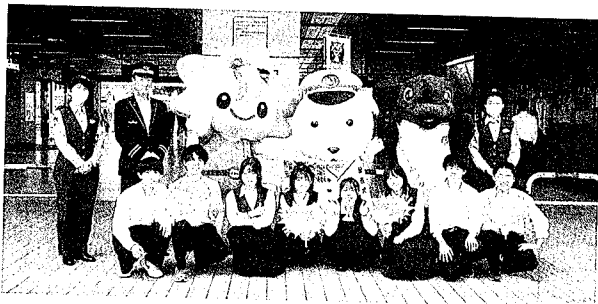
痴漢被害防止キャンペーン