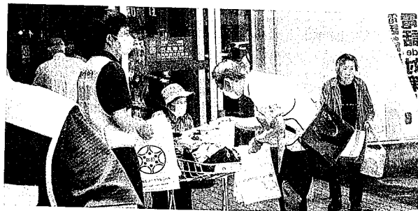
電話d e詐欺被害未然防止キャンペーン